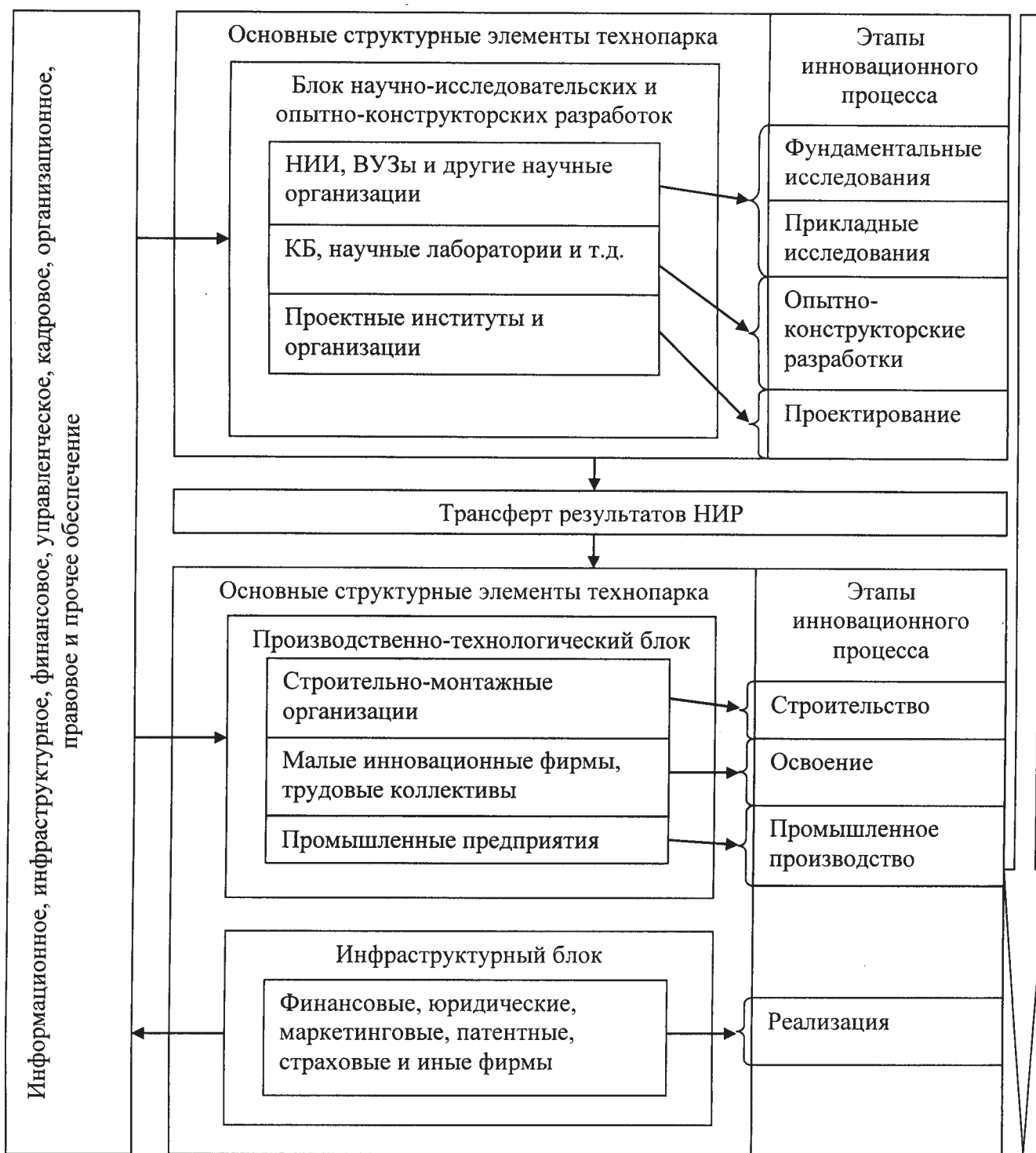
Рис. 2. Функциональная структура технопарка

экономических и административных институтов управления.